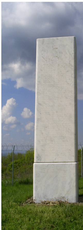
Рис. 4 Нынешний вид Косовского мемориального столба