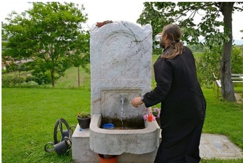
Рис. 13 Мраморный памятник, который считается памятником, стоящим на месте погубления князя Лазаря

Тело князя сначала было похоронено в приштинской церкви св. Георгия: более детальное описание места мы находим в путевом очерке Милоша Миливоевича, который описывает что церковь эта находилась к югу от нынешней церкви по направлению к парку(тогда лесу) Грмия или же к району Источик св. Геория (Джурджанова водица) в квартале, называемом «Семь трубок табака» (Седам лула) (MILIVOJEVIĆ 1872: 52). Через два года в 1391 (или через год, в 1390 году) году тело князя перенесено в монастырь Раваницу возле города Чуприя. В истории мощи несколько раз меняли место пребывания (причиной служили войны): довольно долгое время мощи были в монастыре в Сентендре (нынешняя Венгрия), затем в сремском монастыре Врдник, который также получил название Раваница, в Соборной церкви в Белграде, а в 1988 году перенесены в монастырь Раваница возле Чуприи, где и покоятся ныне.