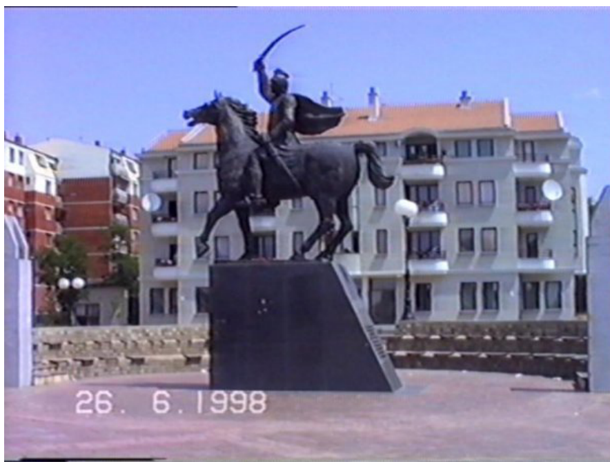
Рис. 12. Установленный в поселке Облич и снесенный албанцами в 1999 году памятник Милошу Обиличу

бытующей в Косово и породившей сюжет поэмы «Дустурнаме» Энвери, которая была написана в 1465 году и которая рассказывает, что Милош Бан (так его зовут в поэме) был приближенным султана, которого тот очень уважал, но позже он крестился и покинул султана. Поэтому султан поверил ему, когда тот сказал, что хочет вернуться в ислам и приблизил его к себе (INALCIK 2000). Данная легенда сформировала и версию об албанском происхождении Милоша, которую активно используют албанцы, особенно в период после 1999 года. Вообще, албанская эпическая традиция восхищается подвигом Милоша Обилича: итальянская журналистка Ана ди Лелио записала восемь албанских песен (скорее восемь вариантов одной песни, которую записывали в свое время и В. Чайканович, и Г. Елезович) (ELEZOVIĆ 1923: 54-67; ČAJKANOVIĆ 1923: 68-77), где так или иначе упоминается Милош Обилич (князя Лазаря нет ни в одной албанской песне о Косово Поле) (DI LELIO 2010), что, впрочем не мешало им переименовать поселок Обилич, находящийся недалеко от места битвы в поселок Кастриоти- взяв родовое имя своего самого известного национального героя Скендербега — Георгия или же Джураджа Кастриоти.