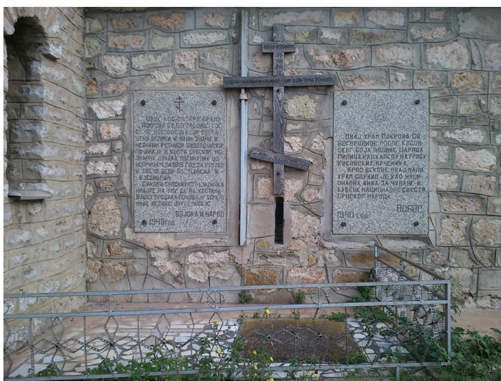
Рис. 8 Крест и таблица на церкви в селе Бабин-Мост

Кроме нее, еще одна церковь на пространстве Косово поля определяется как место захоронения погибших в битве сербов — это церковь Покрова Пресвятой Богородицы в селе Бабин-Мост, которая воздвигнута в 1927 году на месте храма-мавзолея. Идея строительства храма, по преданию, принадлежит самой княгине Милице, жене князя Лазаря. Первоначальный храм-мавзолей был разрушен, а в 1927 году сохранившаяся алтарная часть встроена в структуру нового храма. Продолжая развивать косовский миф как феномен, соединяющий героическое прошлое с недавним прошлым и тем самым объединяя в одно средневековую Сербию и современное в то время государство, в 1940 году туда переносятся останки солдат, погибших в Великой войне, которые упокоение находят в стенах храма.