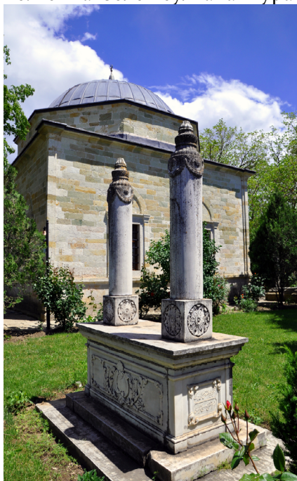
Рис. 11. Первоначальный саркофаг султана Мурата

Соединение этих двух участников битвы видно и в легенде, до сих пор 11 Первод: Знаменитый великий человек из армии Лазаря, неверный Милош Кобилич, притворившись раненым среди павших бойцов в тот момент, когда он целовал руку султану, вытащил из рукава спрятанный ядовитый кинжал, распоро живот султана и сделал его швхидом.