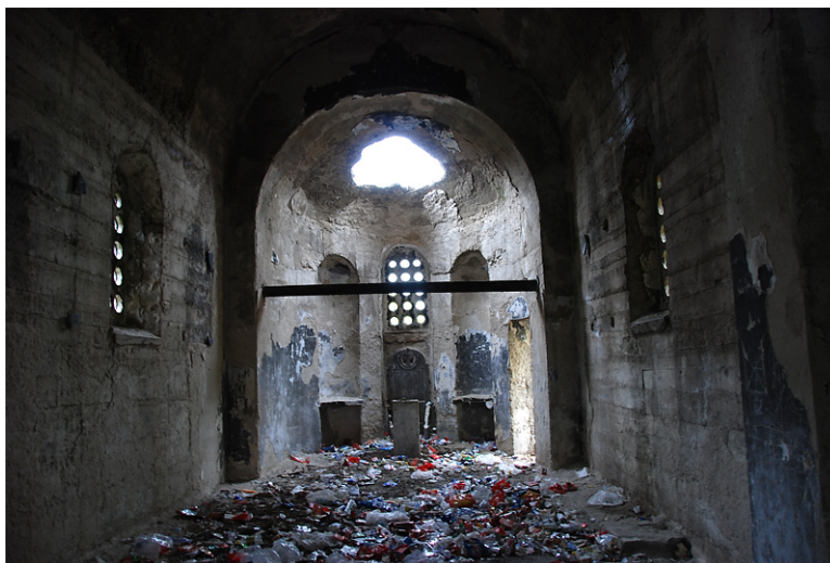
Рис. 7 Нынешнее состояние церкви

Кроме нее, еще одна церковь на пространстве Косово поля определяется как место захоронения погибших в битве сербов — это церковь Покрова Пресвятой Богородицы в селе Бабин-Мост, которая воздвигнута в 1927 году на месте храма-мавзолея. Идея строительства храма, по преданию, принадлежит самой княгине Милице, жене князя Лазаря. Первоначальный храм-мавзолей был разрушен, а в 1927 году сохранившаяся алтарная часть встроена в структуру нового храма. Продолжая развивать косовский миф как феномен, соединяющий героическое прошлое с недавним прошлым и тем самым объединяя в одно средневековую Сербию и современное в то время государство, в 1940 году туда переносятся останки солдат, погибших в Великой войне, которые упокоение находят в стенах храма.