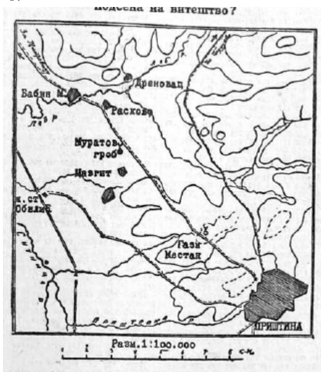
Рис. 2 Карта поля битвы 5

сово и Метохии в состав Сербии) получили названия, связанные с легендой: Лазарево, Обилич, Девять Юговичей и пр. Таким образом, пространство, стало активно сакрализироваться, и косовский миф, и до этого бытовавший в народной памяти и объединявший вокруг себя сербов, начал формировать и пространство, изменяя его и подчиняя мифу.