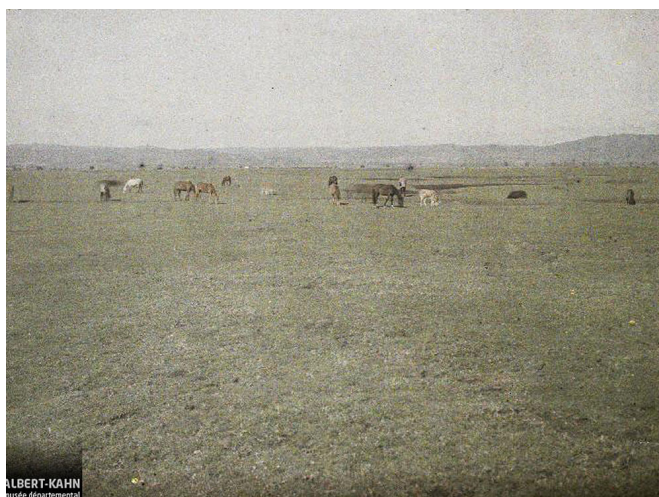
Рис.1 Косово поле, 6 мая 1913 года 4

Само Косово Поле как место битвы в настоящее время ограничивается пространством, центр которого для каждого из народов, использующий косовский миф, будет различным. Для сербов центром пространства является памятник Косовским героям. Для турецкого мифа центром будет могила султана Мурата (Муратово турбе или мавзолей), находящаяся в километре от памятника по направлению к селу Лазарево. По сути, центром места битвы считается место, где легенда свела всех ее участников, поскольку место смерти султана Мурата одновременно обозначено как место гибели Милоша Обилича. Более широкое пространство Поля определяют границы между рекой Ситница, горами Грмеч и Голеш (именно за нее по преданию, отступил Вук Бранкович), рекой Самодржа и потоком Бутовац (иногда можно встретить местное деление на пространство Раваниште (т. е. равнину) и Широкое поле. О Широкое поле пишет в своих путевых заметках А.Гильфердинг, располагая его между Ситницей и горой Голеш (GILFERDING 1856: 198)