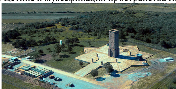
Рис. 5 Памятник Косовским героям

В 1953 году по проекту архитектора Александра Дероко все пространство Газиместана перестраивается, приводится в согласие с бытующим мифом: воздвигается высокий (25 метров) памятник Косовским героями 8 , который, в память о потерянном царстве представляет собой средневековую башню. Идея проекта появилась еще в 20-е годы, когда во время правления короля Александра Первого Карагеоргиевича, создаваемая им страна, вливая новое вино в старые меха, меняла и наполняла новыми смыслами старые сакральные пространственные точки: тогда был разрушен средневековый город Жрнов на горе Авала близ Белграда и воздвигнут памятник Неизвестному солдату, тогда же возникли проекты, которые осуществились уже в социалистической Югославии — строительство нового мавзолея Петра Петровича Негоша в Цетине и музеефикация пространства Косово поля.