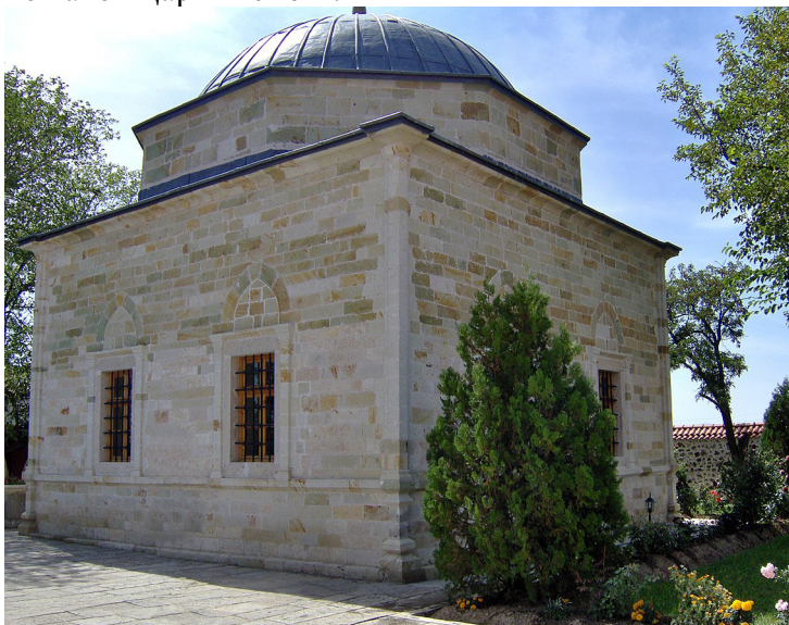
Рис. 10 Мавзолей султана Мурата

ханџар те распори султана и учини га шехидом 11 ..» (ТОМІС 1913: 120) Впрочем со всех сторон герои косовского мифа представлены как герои и одновременно мученики. И литература чутко откликается на народный миф: например в драме Матие Бана «Царь Лазарь или гибель Косово», 1858 г. (ВАН 1867) умирающий султан Мурат говорит Милошу Обиличу - «Я восхищаюсь тобой!» и тот ему отвечает «И мне жаль, поверь, что такой царь гибнет».