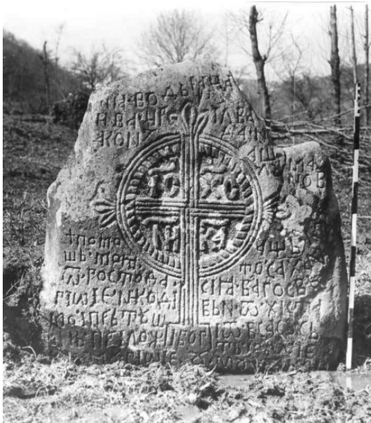
Рис. 3 Крестовой столб с записью, село Горня-Битина, Косово и Метохия 7